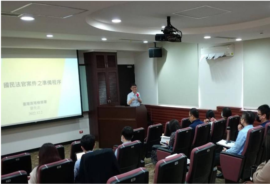
廖先志講座講授「國民法官案件之準備、證據開示與選任」