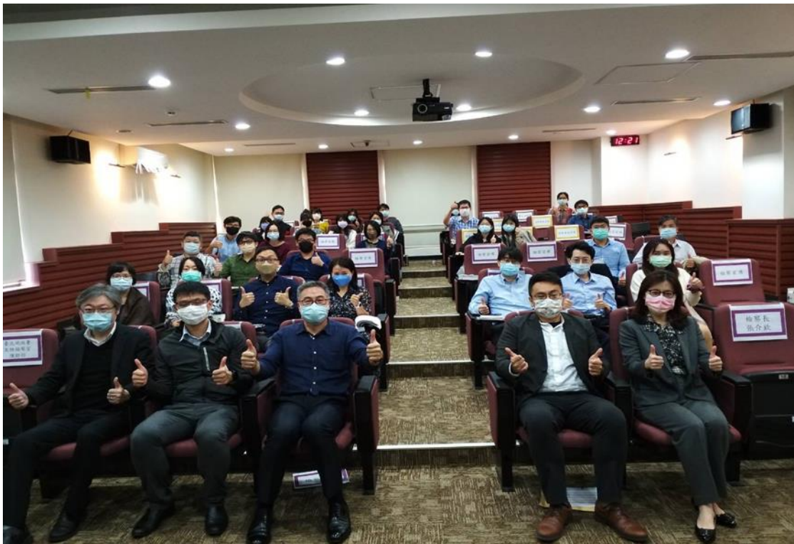
3位講座與本署受訓同仁合照