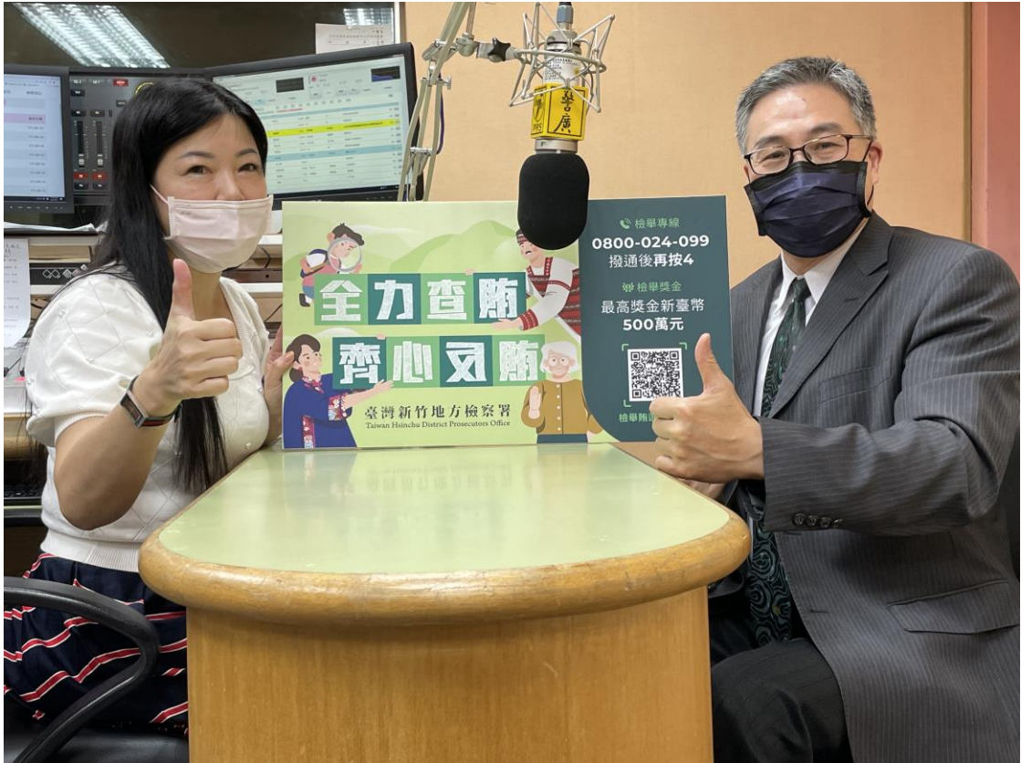
張檢察長空中發聲反賄選