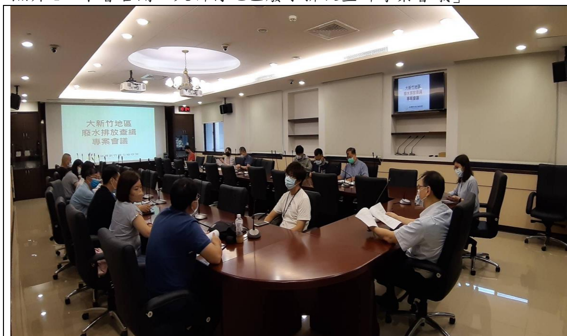
照片 1：本署召開「大新竹地區廢水排放查緝專案會議」

新竹縣諸多有廢水排放之高科技廠均設在民生用水取水口上游（如本案利 0 公司之廢水排放口即位於新埔淨水廠上游 12 公里處），本應保證所排放之廢水完全符合放流水標準，容不得任何疏失。因此在專案會議中也決定，事業有「故意」排放含逾放流水標準重金屬廢水之行為時，應依水污染防治法第 36 條重懲，固不待言，事業即使因「操作疏失」而造成廢水中之重金屬逾放流水標準，也將要求縣(市)環保局將案件移送地檢署，以刑法第 190 條之 1 第 6 項過失放流有害物質罪追究刑責。本署也在此呼籲所有業者均應作好公司內控以盡到環境保護的社會責任（俗稱 ESG 永續），共同維護大新竹地區民眾的用水安全品質。