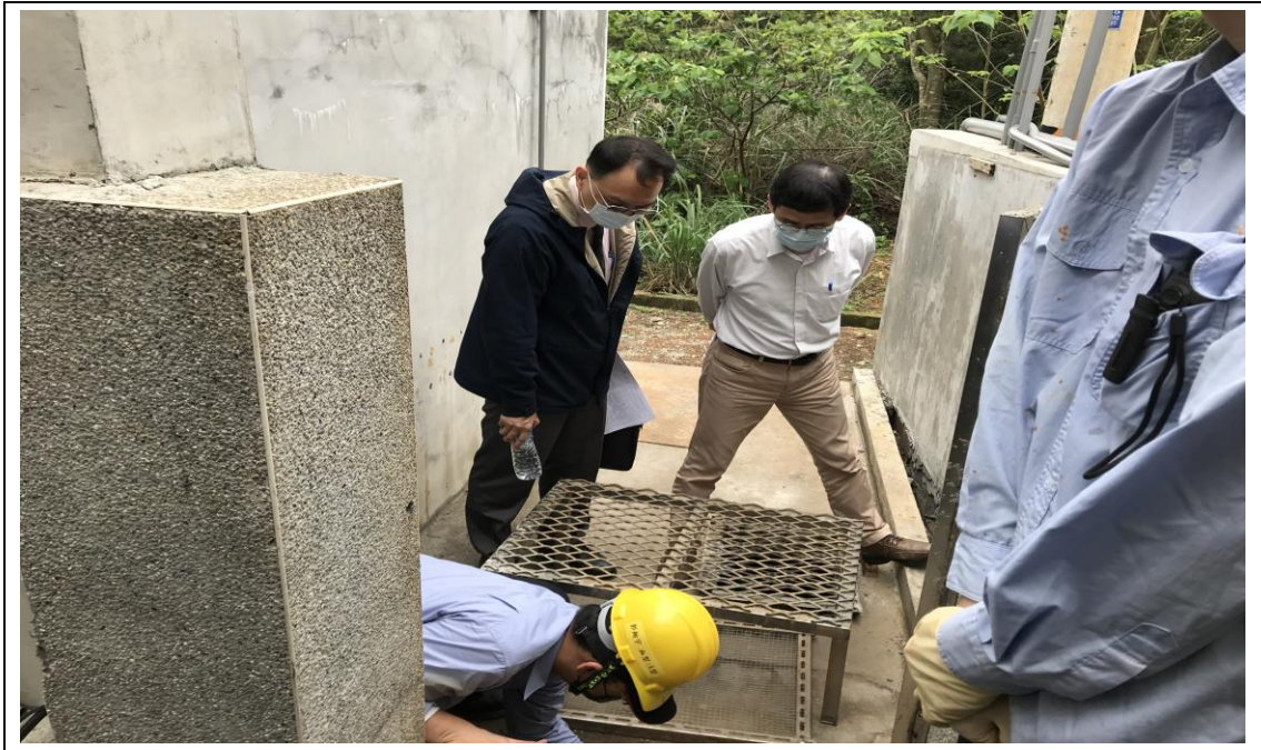
照片 5：本署檢察官前往利 0 公司勘查污水處理措施改善情形