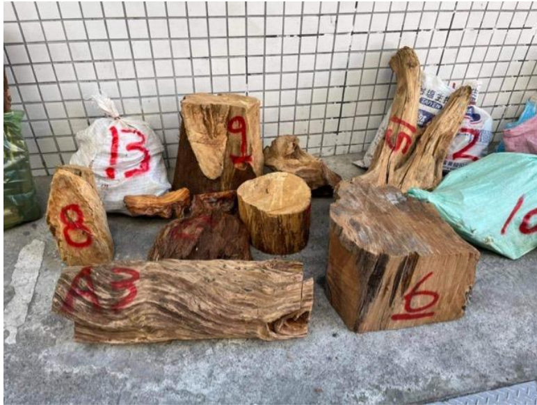
扣案森林貴重木照片