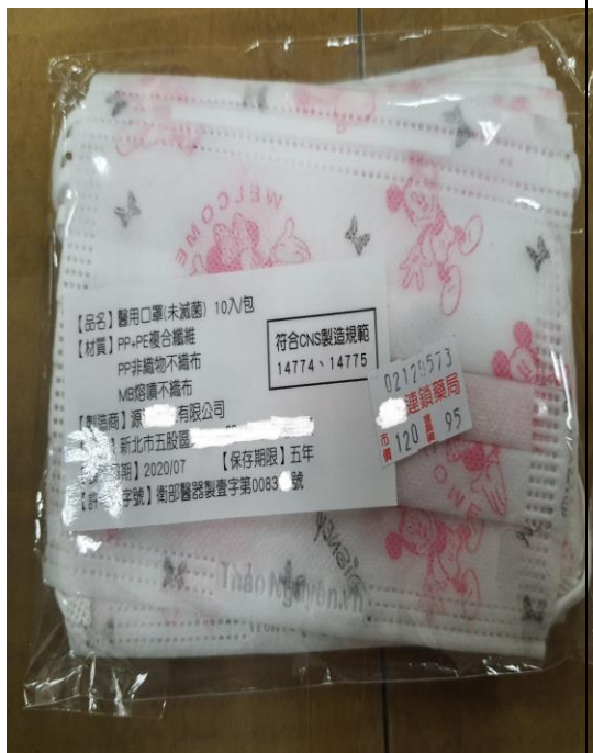
遭偽造之標籤貼紙