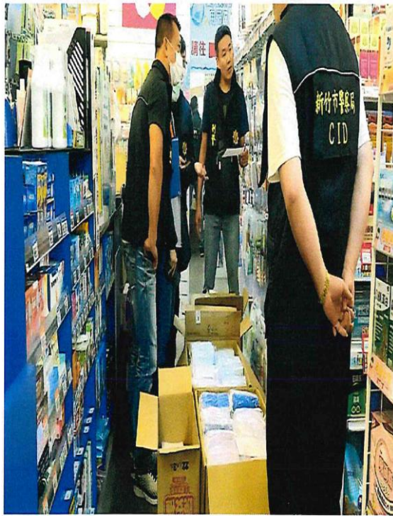
搜索藥局現場照片