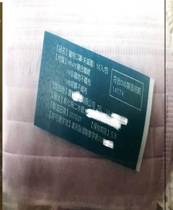
遭偽造之標籤貼紙