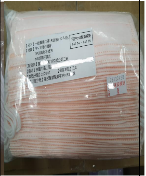
遭偽造之標籤貼紙