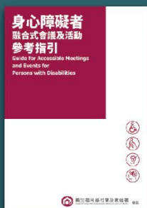
身心障礙者 融合式會議及活動 參考指引