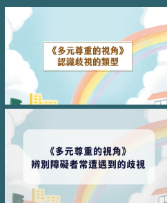
多元尊重的視角 教學影片