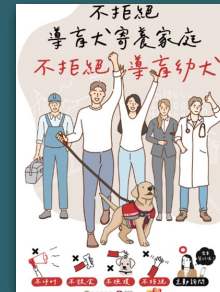
不拒絕導盲犬寄養家庭 不拒絕導盲幼犬