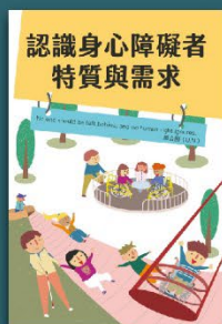
認識身心障礙者 特質與需求