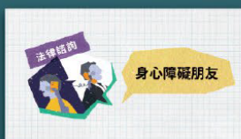
身心障礙者法律扶助專案