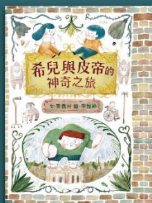
希兒與皮帝的神奇之旅 臺灣手語繪本